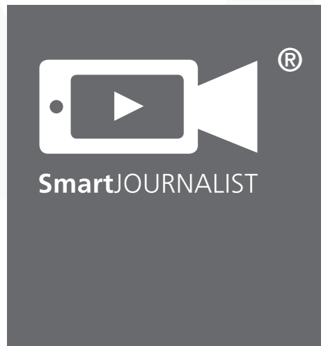
Videoproduktionssystem für die Bewegtbild-Kommunikation